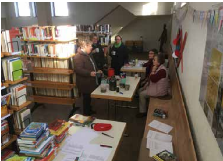
■ Schöpferische Pause des Teams anlässlich der Erhebung in der Christuskirche im Januar 2019