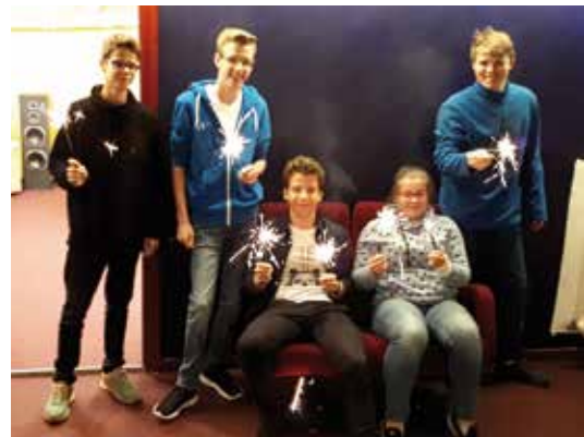
■ Eine Delegation Jugendlicher eröffnet nach getaner Arbeit feierlich den Jugendkeller

Am 18.01. hat sich die Jugendgruppe in unserer Gemeinde getroffen. Gemeinsam besprachen sieben junge Gemeindemitglieder aktuelle Themen rund um die Jugendarbeit