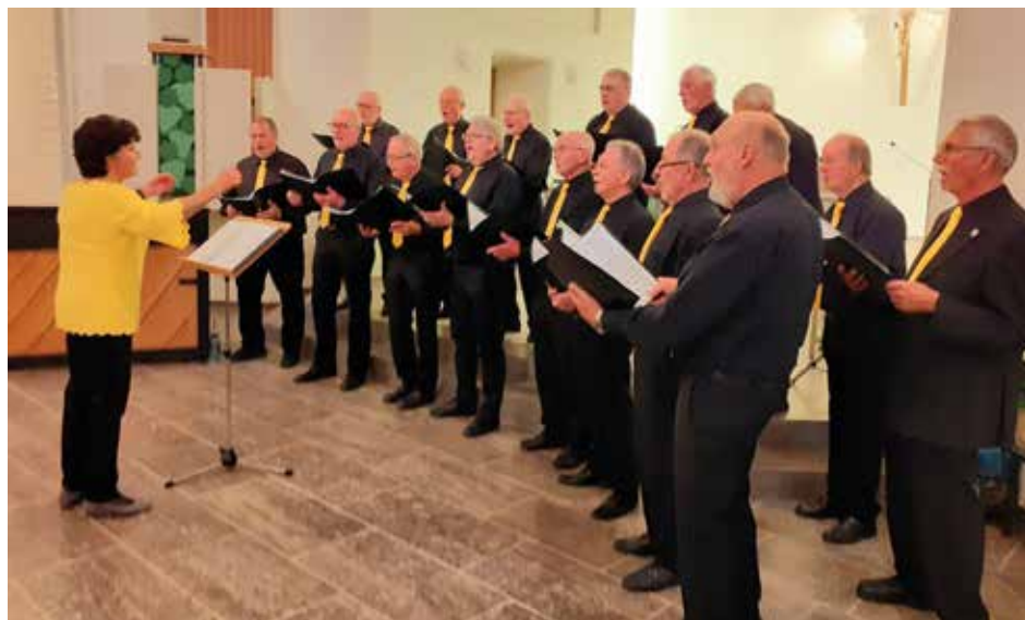
■ Liederkranz Chorserenade Evang. Kirche 2022