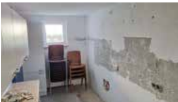
■ Alte Küche, bald Lager für Stühle, Tische und Sonstiges