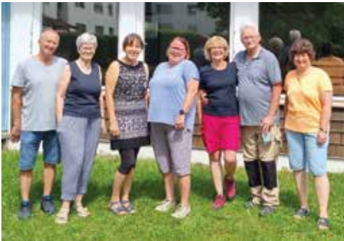
■ Helfer beim Gemeindehaus-Ausräumen