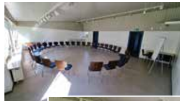
■ Großer Saal provisorisch gestellt