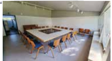
■ Kleiner Saal provisorisch gestellt