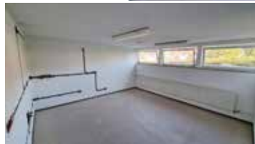
■ Neue Küche